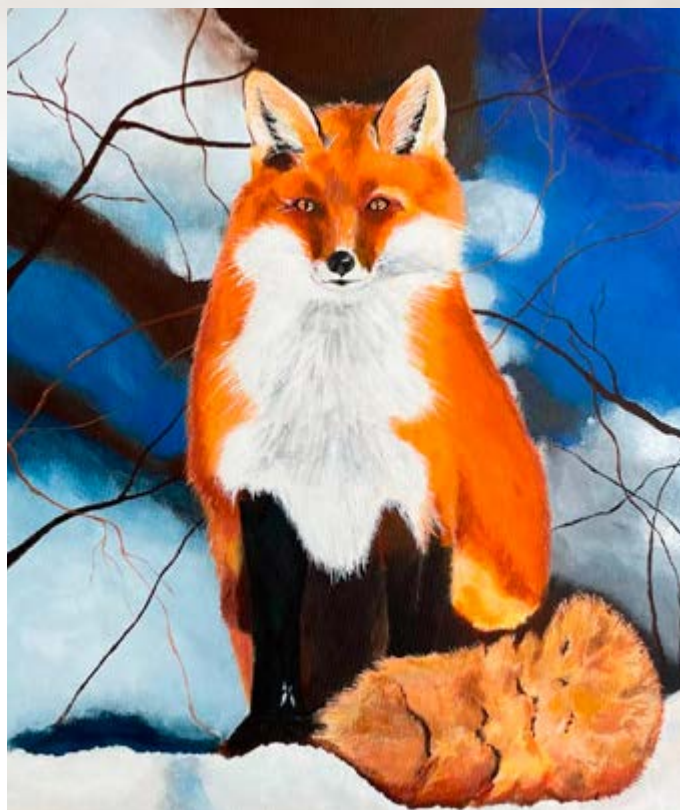
Maleri af Lene Astrup