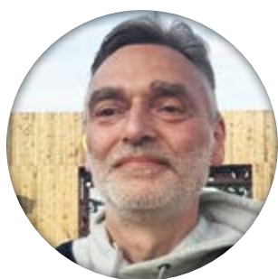
Tekst og foto: Tom Jul Pedersen

I nden for vores forening LAP har vi mange pladser i udvalg og råd. Et af dem har den lange titel: