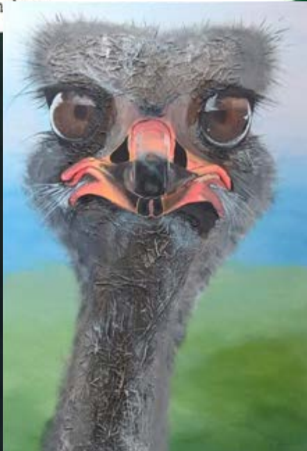
Maleri af Lene Astrup

erindring om armen faldende tungt mod ansigtet i en nærmest lille køllebevægelse jeger ikke bange nu og vil glide indi søvnens asfaltlakerede pyjamas ikke langt herfra, et sted i natten oiber termokan