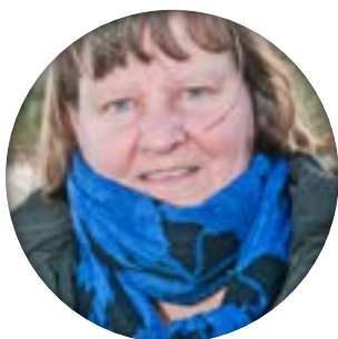
Tekst og foto: Tina Hesselbjerg

Jeg fik idéen og er tovholder til dette pilotprojekt, som er i en opstartsfasen, hvor vi er ved at lægge skinnerne så toget kan køre. Der er mulighed for at være 9 i denne gruppe.