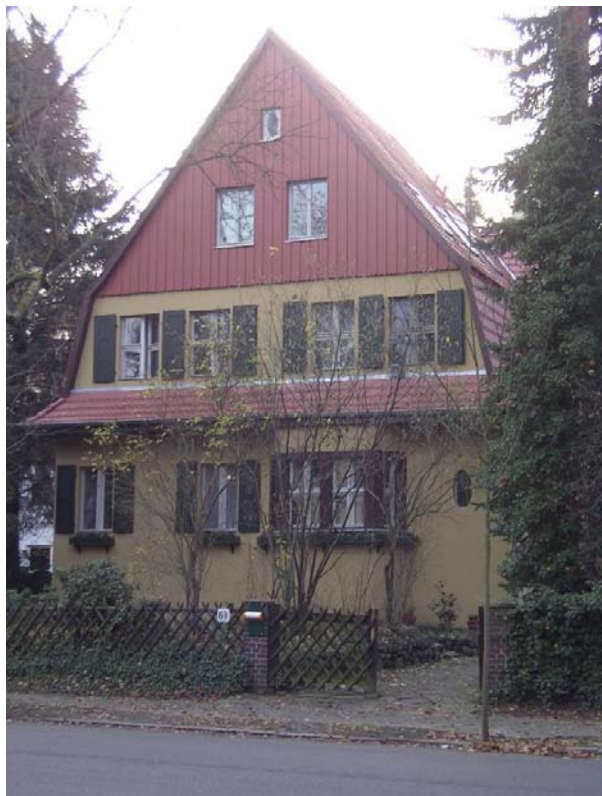
Villa Stöckle i Berlin - et Weglaufhaus.

kan tilbyde. Stedet er offentligt finansieret og baserer sin virksomhed på en platform, der forholder sig til menneskesyn, samfund og psykiatrien.